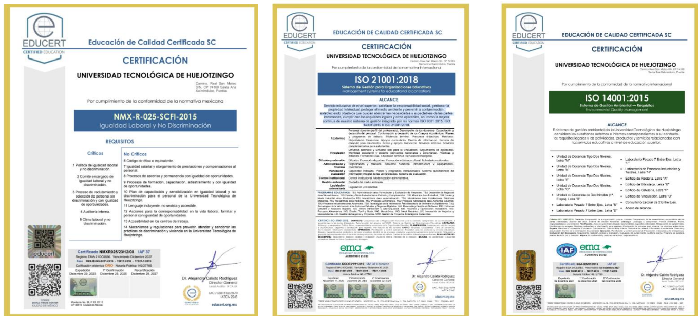
Fig. 1. Certificaciones